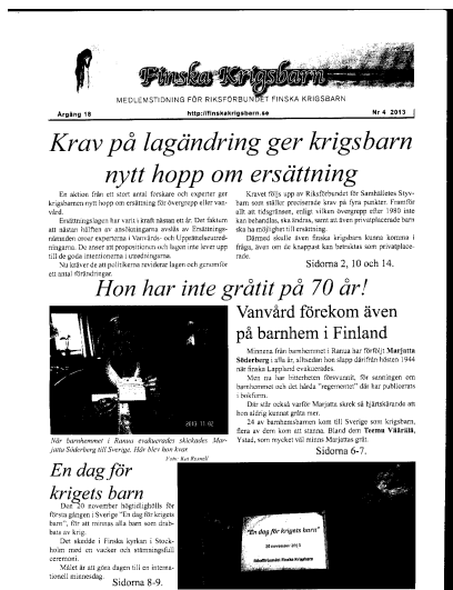
Finska Krigsbarn nr 4 2013, SfA

På nationell nivå skapade förflyttningarna av krigsbarn på längre sikt livslånga vänskapsband mellan krigsbarn och grannländerna. Men för de barn som blev kvar i Sverige fanns inte sällan en känsla av att ha blivit avvisade. Dessa har i sina berättelser och intervjuer betonat ett psykiskt lidande på ett helt annat sätt än den majoritet barn som återvände till Finland. Några av dem som har förlorat sin barndom som följd av dessa ödesdigra händelser och beslut söker idag ersättning från den svenska staten för sina psykiska lidanden t ex på barnhem – tills vidare utan resultat. (Se: http://www.svt.se/nyheter/sverige/finska-krigsbarn-kraver-ersattning-fran-sverige )